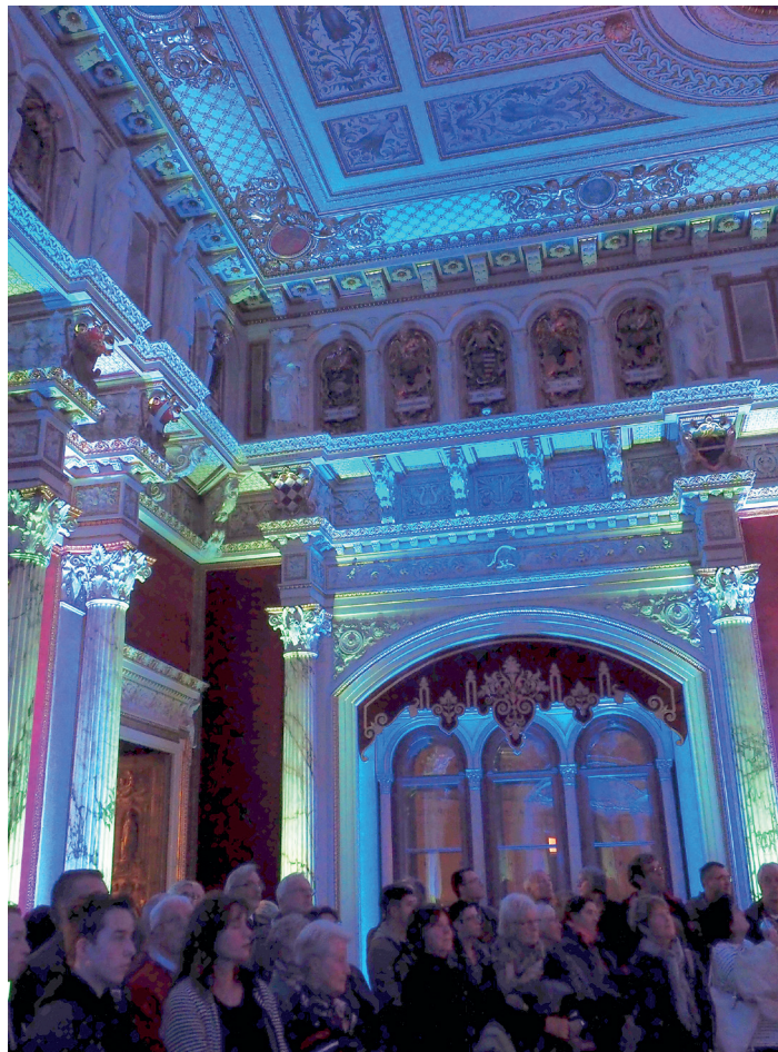
Kulturbegeisterte können am 28. Oktober Musik, Theater, Ausstellungen, Workshops, Lesungen und Puppenspiel erleben.

Ausstellungseröffnung wird indessen in der „gallery berger“ gefeiert, wo sich 18 Künstler, porträtiert von Anke Berger, mit ihren Werken aus Malerei,