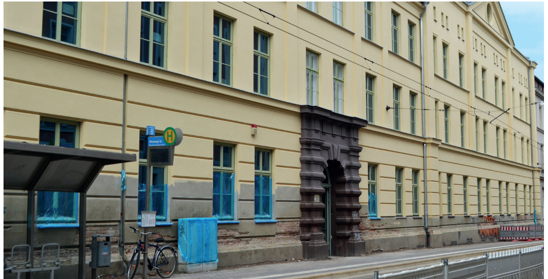
Mit Beginn des neuen Schuljahres können die Kinder der Friedensschule und der Fritz-Reuter-Schule den neuen Hort nutzen.

Der von der Kita gGmbH betriebene Hort soll pünktlich zum Beginn des neuen Schuljahres in Dienst gehen. „Wir liegen im Zeitplan, so dass der neue Hort den Kindern der Friedensschule und der Fritz-Reuter-Schule mit Schuljahresbeginn 2018/2019 zur Verfügung steht“, so Oberbürgermeister Rico Badenschier. Die Stadt erfüllt damit die in der Kitabedarfsplanung festgeschriebenen Hortkapazitäten und leistet einen wichtigen Beitrag zur Absicherung der Schulplatzkapazitäten in der Innenstadt. Insgesamt werden in dem neuen Hort zukünftig 308 Mädchen und Jungen der beiden Schulen in 27 Räumen mit vielfältiger Nutzung betreut. Zur Verfügung stehen neben Gruppen- und Hausaufgabenräumen ein Kinderrestaurant für die tägliche Essenversorgung, eine Kinderküche, ein Sport- und Mehrzweckraum, Kreativräume, Theaterräume, eine Bibliothek, Medienräume, ein Forscherraum sowie ein Spielraum, der den historischen Charakter des Hauses bewahrt. In der Außenanlage