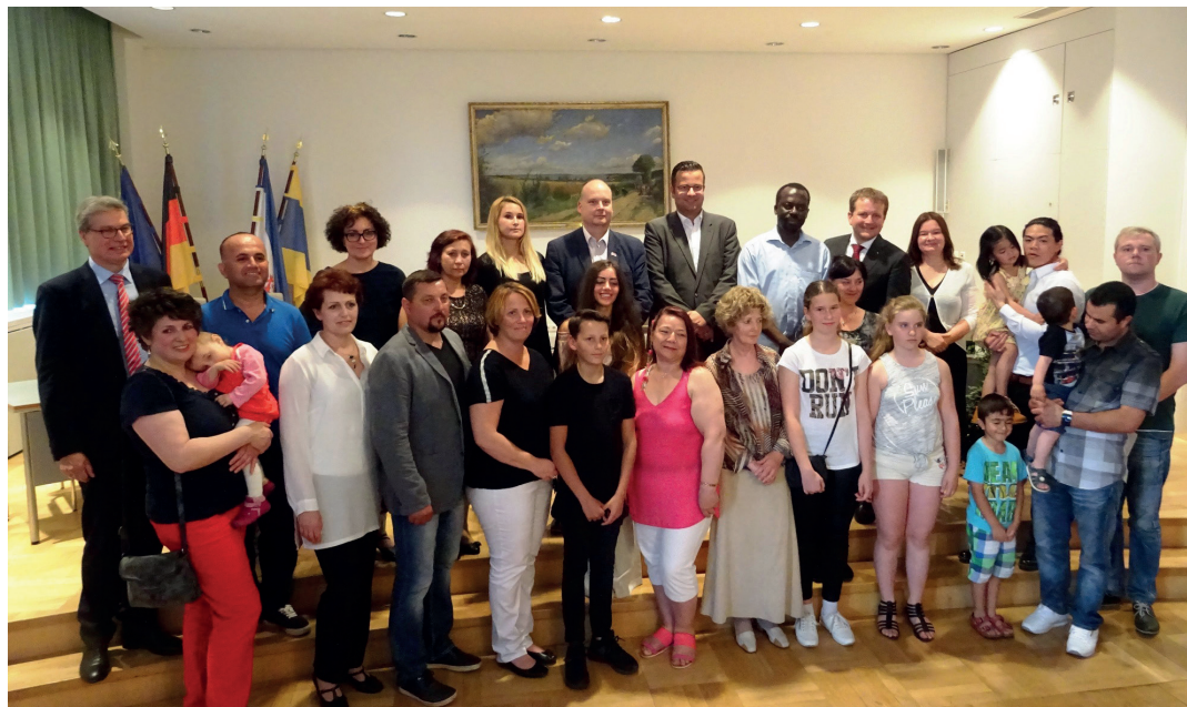
Einbürgerungsfeier im Demmlersaal des Rathauses.

„Die Entscheidung für die deutsche Staatsbürgerschaft ist ein Zeichen gelingender Integration und ein Bekenntnis zu unseren Werten. Wir sind stolz, dass Sie zu uns