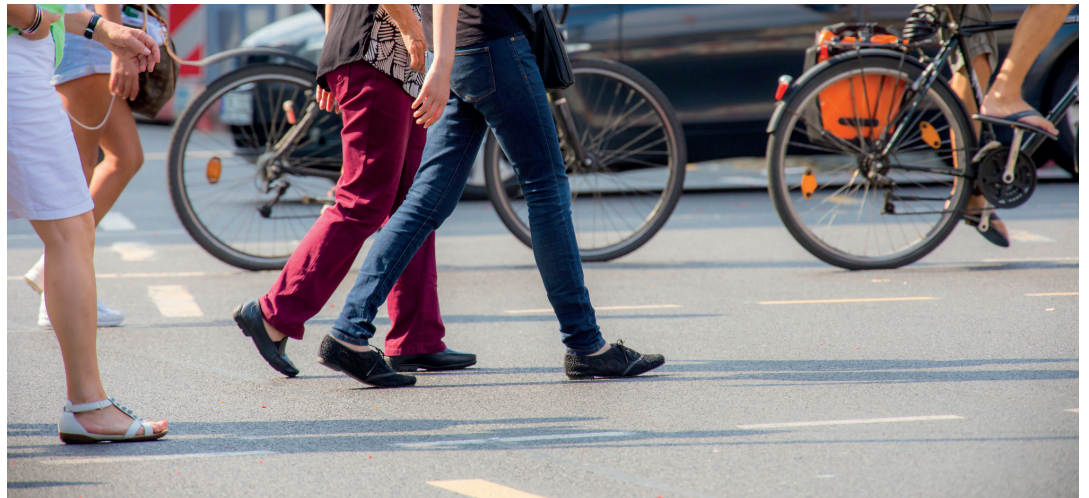
Noch bis Ende des Jahres läuft die Haushaltsbefragung der Technischen Universität in Dresden zur alltäglichen Mobilität der Bevölkerung in Schwerin.

„Wir möchten aber auch die in den nächsten Wochen ausgewählten Haushalte bitten, an der Umfrage teilzunehmen“, appelliert Geert Böcker, Fachgruppenleiter Verkehrsplanung in der Schweriner Stadtverwaltung. „Die Teilnahme ist freiwillig. Aber jeder